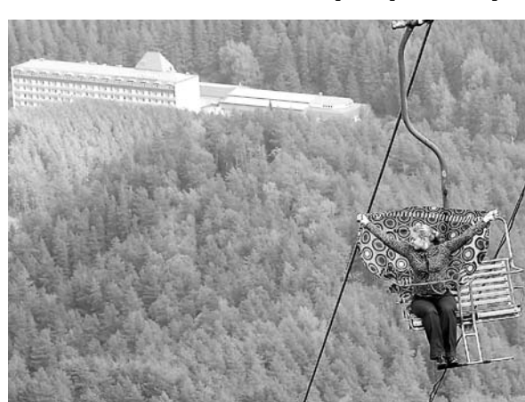
не 6,3% всех туристических доходов. На 1 евро госинвестиций в проект в итоге пришлось 10 евро частных. Появилось 56 000 новых рабочих мест, а Валь д'Эроп, расположенный в 32 км от Парижа, стал международным транспортным хабом.

Также правительство построило около парка станцию трансъевропейского экспресса, предоставило Walt Disney льготные займы и субсидии на $800 млн и установило эффективную налоговую ставку 5,5% вместо 18,6%. Частный инвестор в свою очередь вложил 100 млн евро собственных средств, а также привлек 1 млрд евро на бирже и еще столько же у банков. Это позволило спроектировать и построить парк, который посещает треть всех туристов, приезжающих во Францию, и который приносит стра-